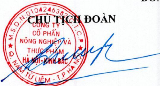
DƯƠNG QUANG LƯ